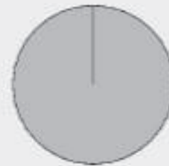
2 Taxonomiekonformität der Investitionen ohne Staatsanleihen*