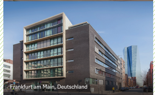
Frankfurt am Main, Deutschland