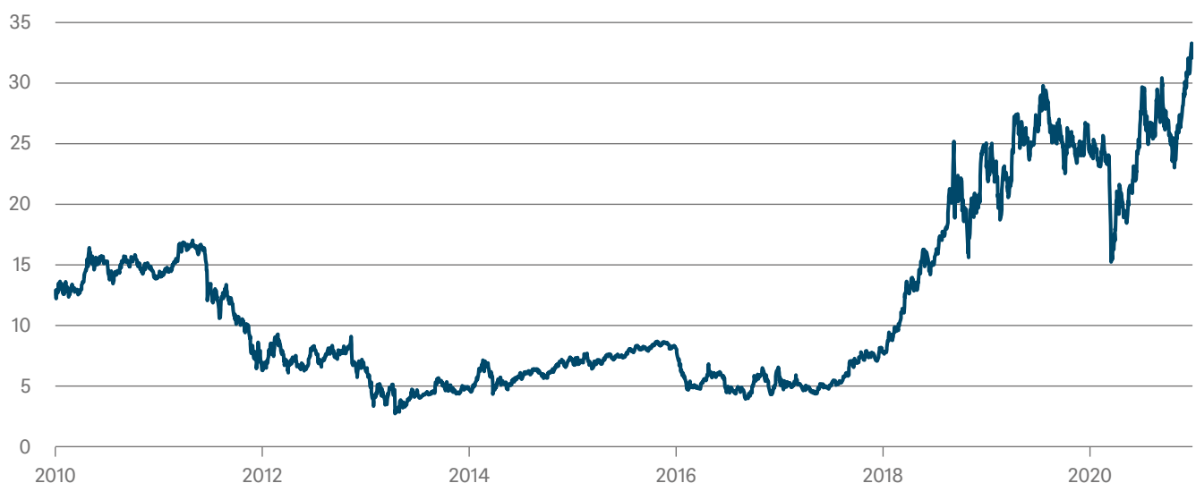
Kohlenstoffpreis (Euro pro Tonne) im EU EHS

Quellen: Bloomberg Finance L.P. und DWS Investment GmbH, Stand: 04.03.2021